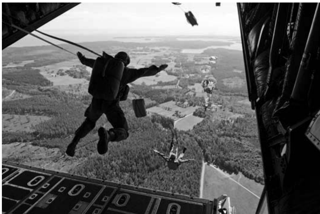
Bild: Kadetter ur Officersprogrammet 13-16 (222 qzrn) genomför sitt första fallskärms hopp med automatutlöst rundkalottsfallskärm över Flugebyn utanför Karlsborg i augusti 2015. Utdragsremmarna som drar ut fallskärmen då hopparen lämnar flygplanet är tydligt synliga. Uthoppshöjden är cirka 400 meter.

öka risken för felfunktioner. Hoppturnet är den plats där de flesta upplever problem på grund av höjden, oftast i större utsträckning än under hopp från flygplanet. Människans inbyggda respekt för höjder bygger på att vi har referenser som gör att vi kan uppskatta höjden, och därmed faran med var vi befinner oss. På grund av detta är ett språng från det 12,5 meter höga hoppturnet, i nivå med trädtopparna, för de flesta mer skrämmande än ett hopp från flygplanet på 400 meters höjd där världen under ser ut som ett miniatyrlandskap.