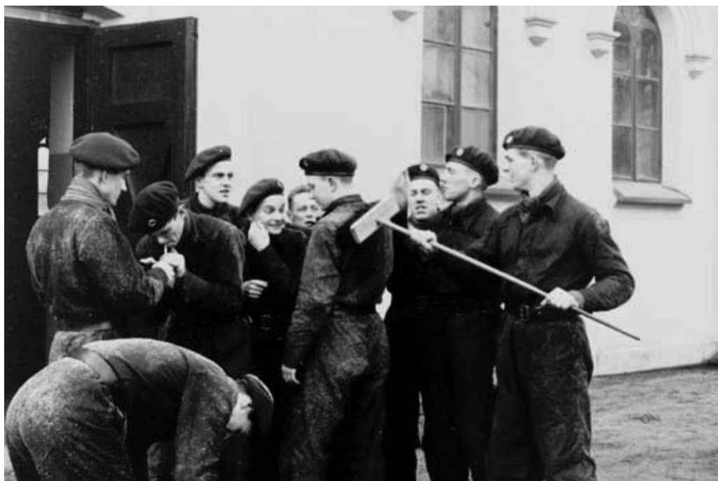
Bild: OK56 var den första kullen där 10 frivilliga kadetter, uttagna för spänst och framstående resultat, fick genomgå hoppkurs på FJS. 60 år senare har utbildningen ökat i omfattning men utbildningsmetodiken i stort och proceduren att borsta bort sågspånet från träningshallen efter att ha övat fallskärmsrullningar är densamma. På bilden ses OK57 under det andra årets kurs.

infanteriet och kavalleriet. 1999 återgick den grundläggande officersutbildningen till tre Militärhögskolor i Östersund, Halmstad och Karlberg vilka alla gemensamt övertog kadettkursen. Idag kvarstår grundläggande officersutbildning på Militärhögskolan Karlberg, och fallskärmsutbildningen ingår som ett av kursmomenten inom det övergripande momentet Officersprofessionen. 19