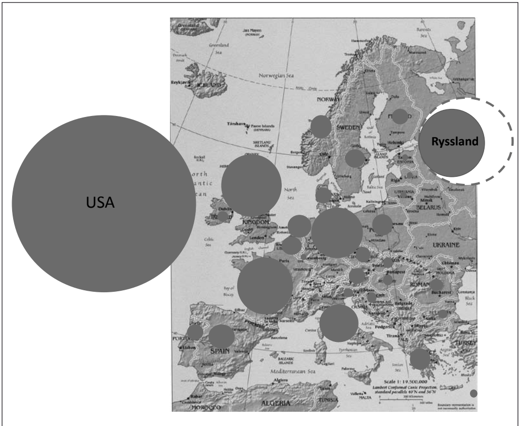
Diagram 2: Försvarsutgifternas geografiska fördelning 2011 (streckade cirkeln indikerar rysk planerad försvarssatsning cirka 2020)

iska säkerhetsordning som etablerades efter det kalla kriget.