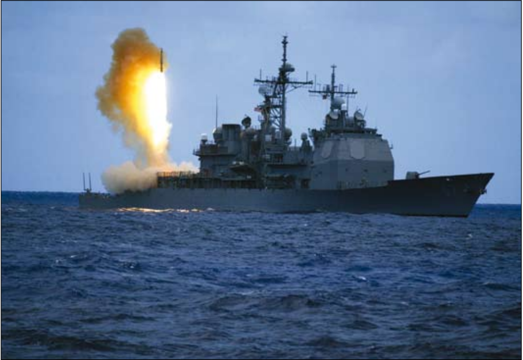
Prov med SM-3-missilen från kryssare av Ticonderoga-klass 2006. Missilen ingår i Aegis Ballistic Missile Defense System som av president Obama deployerades till Europa som en interimslösning i avvaktan på en lösning av de politiska motsättningarna med Ryssland om missilförsvaret.

Osäkerheten rörande den framtida amerikanska strategin, i kombination med Rysslands modernisering av sitt försvar, har manifesterats i en ökande bilateral spänning inom rustningskontrollfältet – allra främst rörande missilförvarsfrågorna och därmed sammanhängande strategiska förändringar. USA:s och Natos planer på ett integrerat missilförvarssystem täckande Europa med omgivning, särskilt i sydöst, uppfattas av Ryssland som ett hot mot dess strategiska kärnvapenförmåga, d v s dess vitala säkerhet.