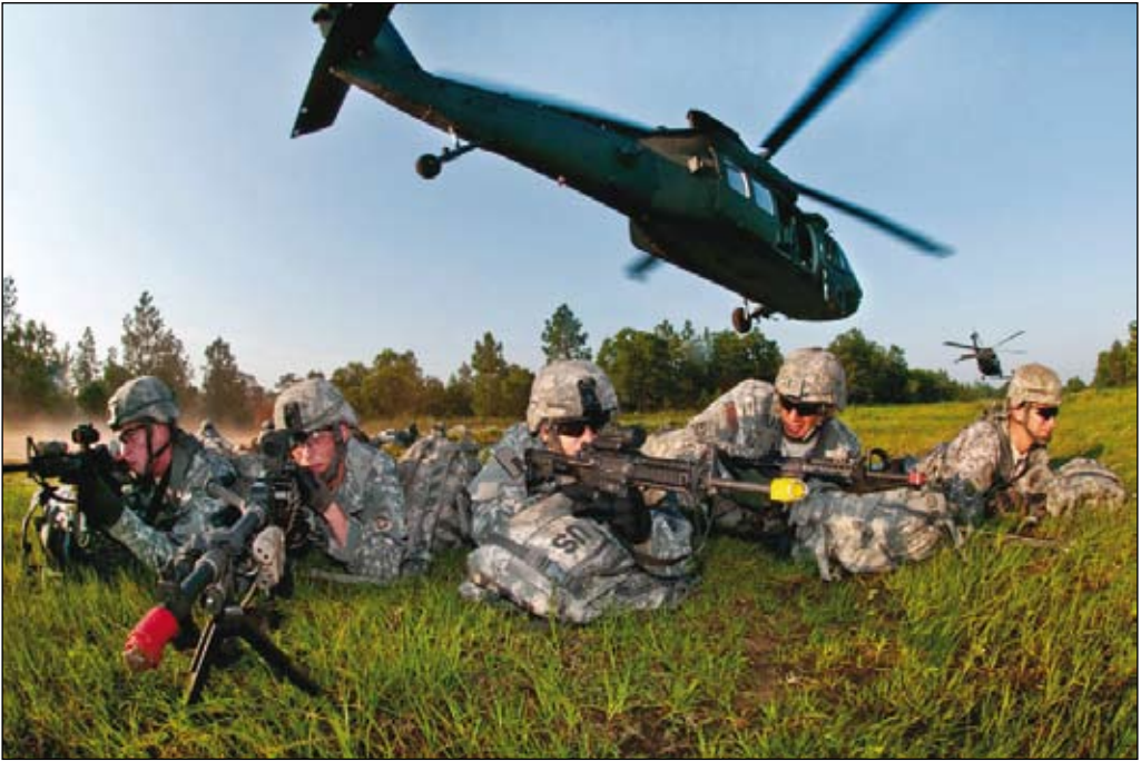
Trupp ur 82nd Airborne Division, ett av de amerikanska förbanden med expeditionär förmåga.

att det en dag uppstår strategiska överraskningar.