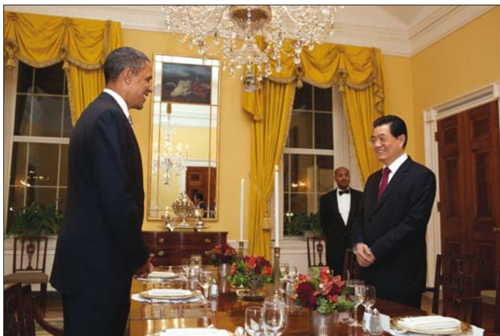
Mycket att avhandla. Presidenterna Barack Obama och Hu Jintao inleder arbetsmiddag i Vita huset 18 januari 2011.

främsta katalysator med djup påverkan också på andra viktiga förhållanden som inte brukar hänföras till den ekonomiska sfären. Globaliseringen med sina flöden av varor, pengar och information har lett till en internationell arbetsfördelning som kopplar samman det lokala med det globala. Föreställningar om att utvecklingen måste fortsätta i ett linjärt spår, måste dock starkt ifrågasättas. Globalisering är inte ett nytt fenomen; världsekonomin var mer integrerad under slutet av 1800-talet än på 1990-talet – först då nådde kapitalflödena relativt världsekonomin storlek den nivå de haft före första världskriget. Det kan vara värt att begrunda att den integrerade ekonomin då ofta sades omöjliggöra krig. Likväl bröt första världskriget ut.