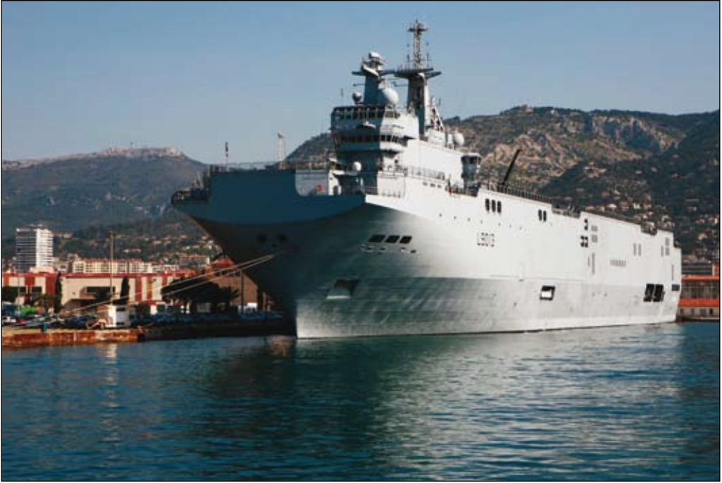
Franska amfibiefartyget Mistral i Toulons hamn. Ryssland har beställt två fartyg med option på ytterligare två. Fartyget kan transportera exempelvis en pansarbataljon.

förhållanden och bidrar till att göra regionen mer åtkomlig. Klimatförändringen är den främsta drivkraften mot ett nytt Arktis.