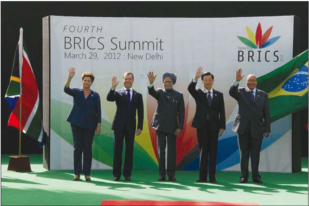
BRICS-toppmötet 29 mars 2012