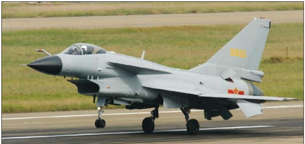
Överst: Kinesiska jagaren Haribing på flottbesök i San Diego. I mitten: Kinas nyaste strategiska robotubåt (SSBN) Jin-klassen. Nederst: Chengdu J-10 Multirole fighter. I tjänst år 2005. 210 st hade producerats år 2011. Kina har världens till storleken tredje flygvapen.