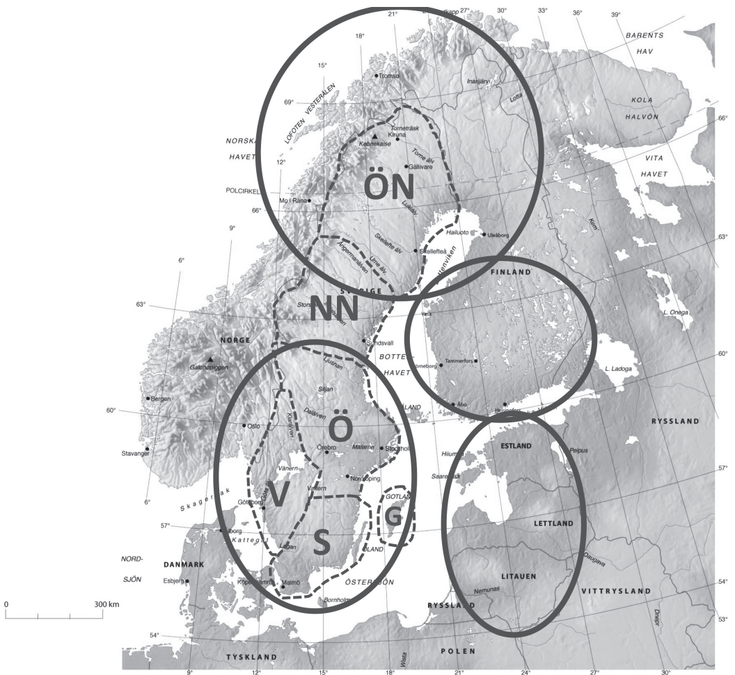
Bild 3. Skiss till Nato markoperativ indelning i Nordeuropa (heldraget) och markterritoriell indelning i Sverige (streckat).

svenska eller Natooperationer. Den militära organisationen ska också kunna användas för att stödja samhället, om krig inte råder, utan att motverka förmågan att svara upp mot en eskalation.